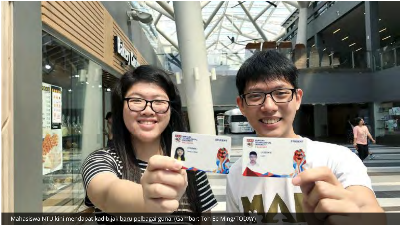
Mahasiswa NTU kini mendapat kad bijak baru pelbagai guna.